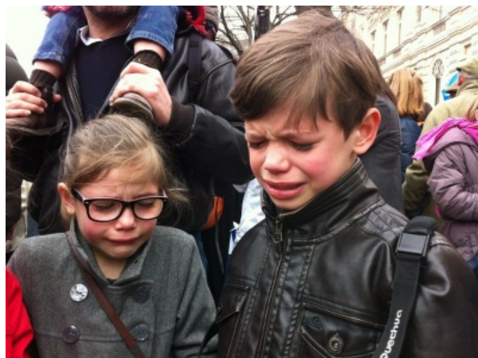
Photo : Des enfants gazés par les forces de l'ordre, dimanche dernier, sur les Champs-Élysées.